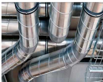
Фланцевые соединения вентиляции