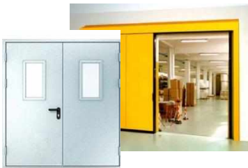
Противопожарные двери и ворота